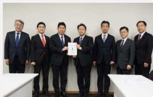
公明党（令和7年12月24日）