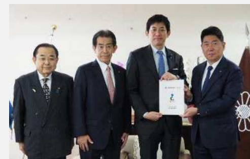
自由民主党（令和7年12月12日）