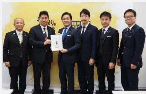
国民民主党（令和7年12月11日）