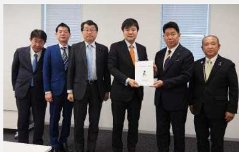
立憲民主党（令和7年12月11日）