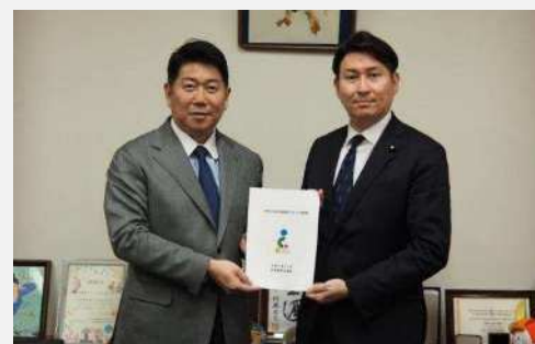
日本維新の会（令和7年12月25日）