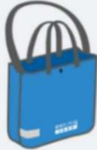
調査員バッグ(見本)