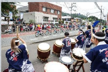
地域との盛り上がり