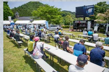
フィニッシュ会場での大型ビジョン放映やブース出店