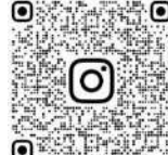
相模原市職員採用 Instagram