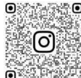
相模原市職員採用 Instagram