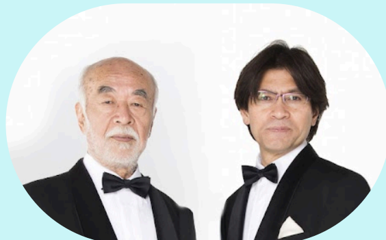
ボニージャックス