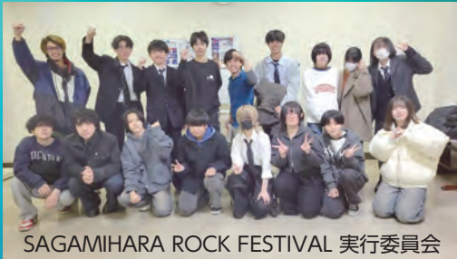
SAGAMIHARA ROCK FESTIVAL 実行委員会

若きアーティストたちが、市民会館をライブハウスに変えます。 ぜひ私たちの情熱を受け止めて来てください!