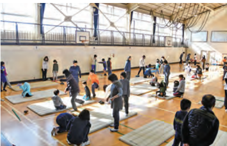
▲親子体操体験教室の様子