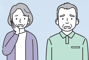
市内の住民死亡者数