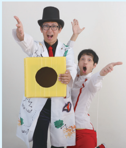
出演キャラメルマシーン