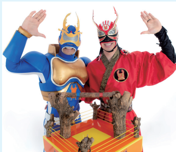
出演昆虫ヒーローズ