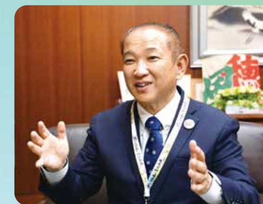
相模原市長 本村 賢太郎

今後も誰一人取り残さない共生社会の実現に向け、市民の皆さんとともに歩んでまいります。