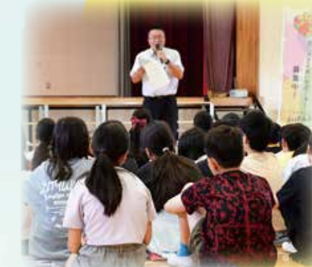
▲若松小学校での講座の様子

養成講座は、企業・団体のほか、個人でもオンラインで受講できます。また、小・中学校で出前授業として実施しています。※受講方法など詳しくは、市庁舎を閲覧ください。